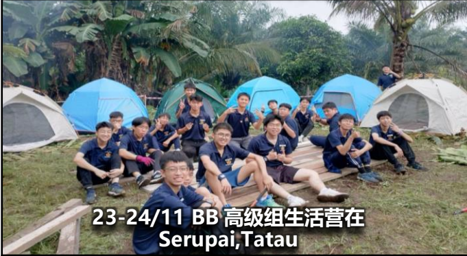
23-24/11 BB 高级组生活营在 Serupai, Tatau