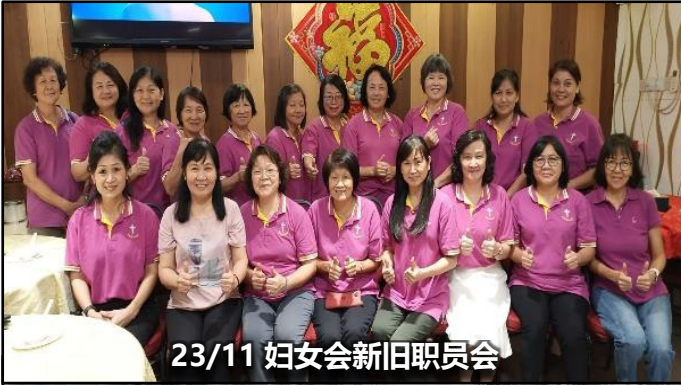
23/11 妇女会新旧职员会