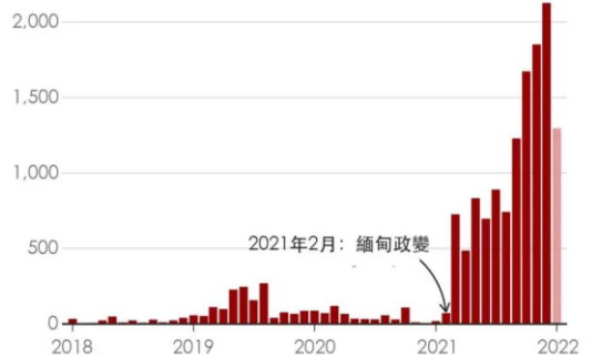
缅甸冲突已导致越来越多人死亡 每月报告的冲突和示威死亡人数